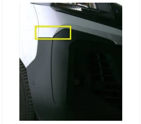
Malfaçon / Imperfection(s) - Moyen