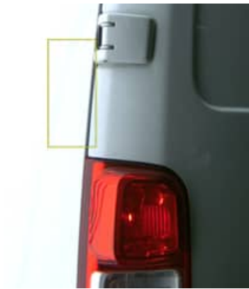
Enfoncement(s) - Léger / Faible