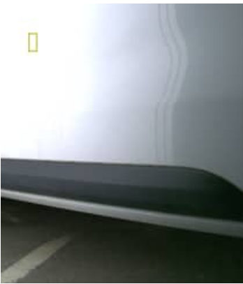
Rayure(s) - Superficiel