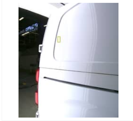
Enfoncement(s) - Superficiel