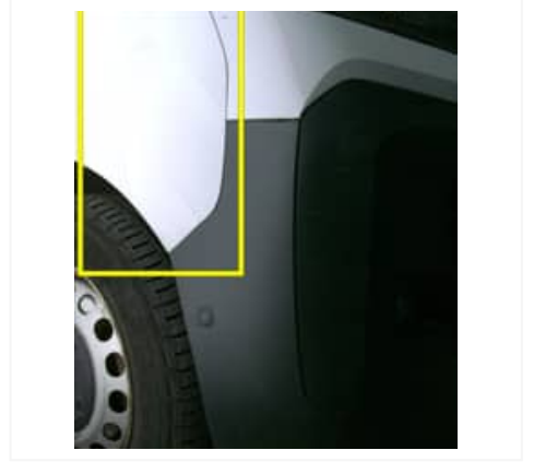
Enfoncement(s) - Moyen