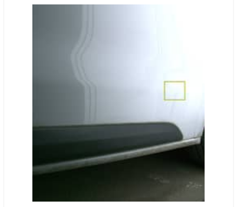
Enfoncement(s) - Léger / Faible