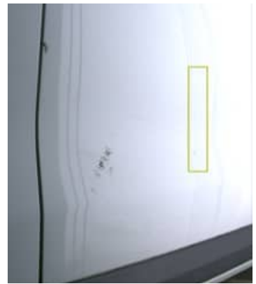
Enfoncement(s) - Léger / Faible