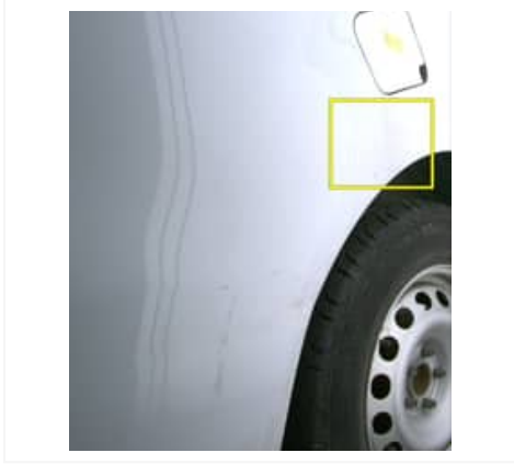
Rayure(s) - Léger / Faible