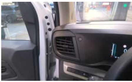
Autre(s) dommage(s) habitacle