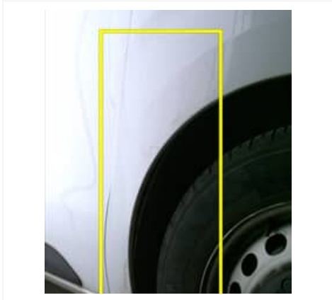
Rayure(s) - Fort