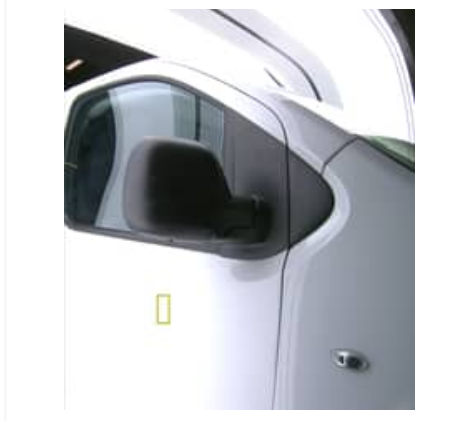
Enfoncement(s) - Superficiel