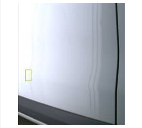
Enfoncement(s) - Superficiel